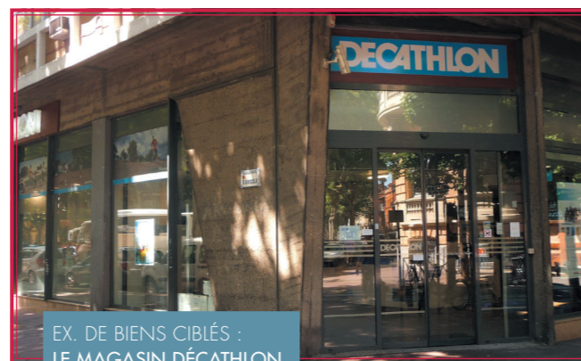
EX. DE BIENS CIBLÉS : LE MAGASIN DÉCATHLON DANS LE CENTRE-VILLE DE TOULOUSE

Carac Perspectives Immo permet l'accès à ce marché. Il facilite l'investissement dans la pierre, même avec des sommes limitées, ce qui est impossible avec un achat en direct.